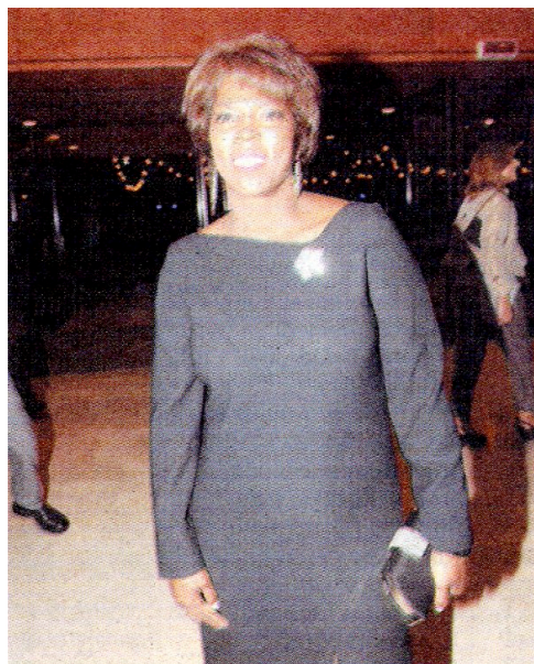
L'ambasciatrice Usa alla Fao Ertharin Cousin